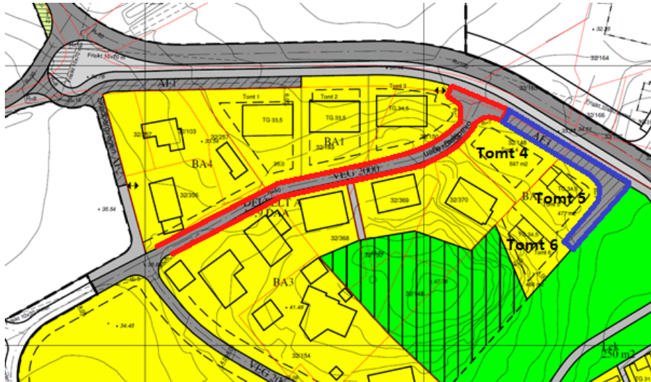
Illustrasjon 2: Plan 0330. Viser vei 2000 markert i rødt og vei AF3 i blått

Flyttingen av vei AF3 (se illustrasjon 3, nytt plankart, under) fører til at totalt veiareal reduseres, og boligareal øker tilsvarende. Eiendomsgrensene er justert slik at antall kvadratmeter boligareal blir likt fordelt mellom tomt 4, 5 og 6. Byggegrenser og juridisk linje for planlagt bebyggelse for tomtene er også justert som følge av flyttingen.