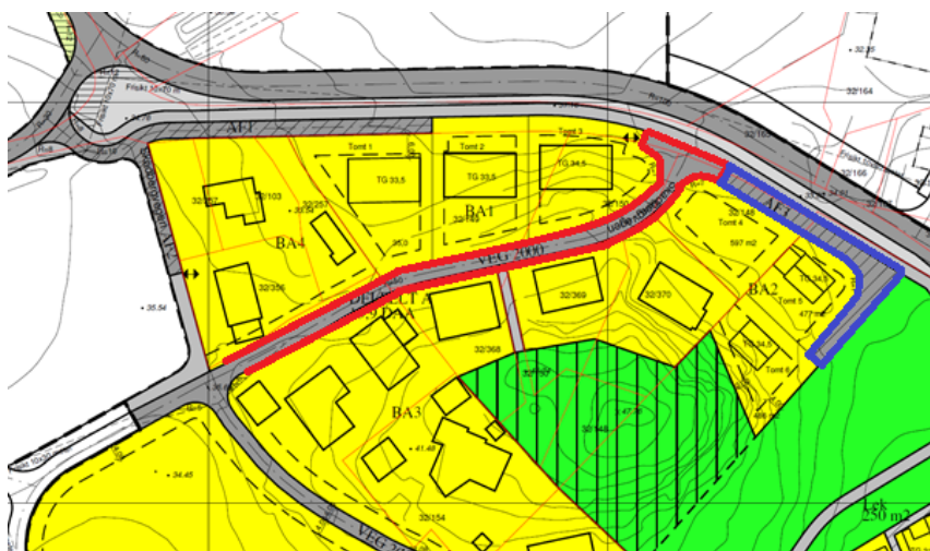
Illustrasjon 2: Plan 0330. Viser vei 2000 markert i rødt og vei AF3 i blått