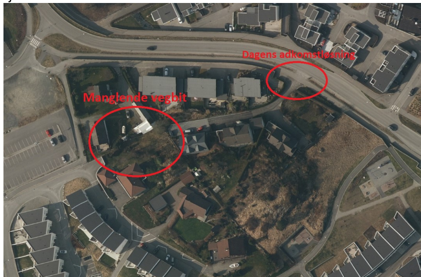
Illustrasjon 2: Veg 2000, manglende strekning og dagens adkomstløsning